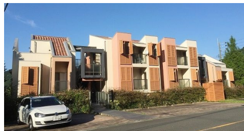
外観は南欧をイメージ!