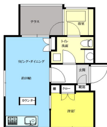
1LDK! 設備が充実しています