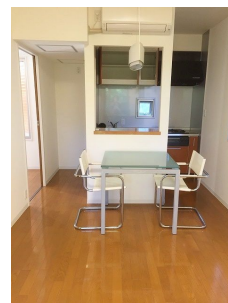
ダイニング、カウンター付!