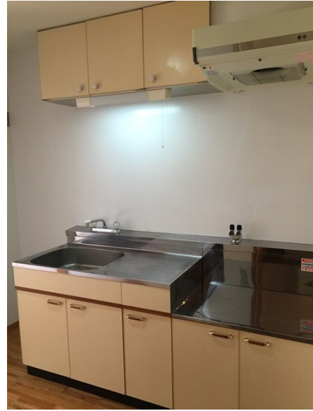
流し台も大きめです