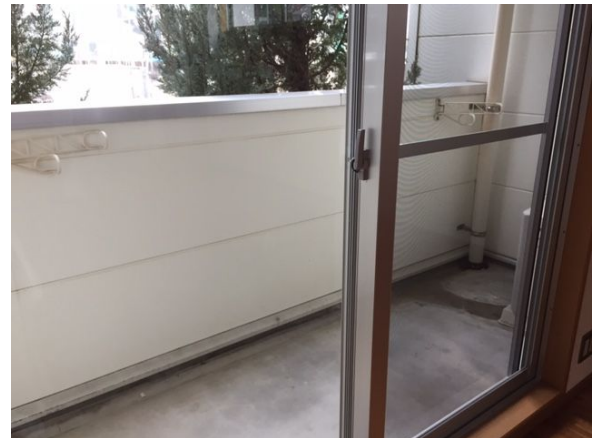
広めのバルコニーです