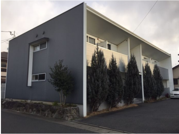
おしゃれな外観です