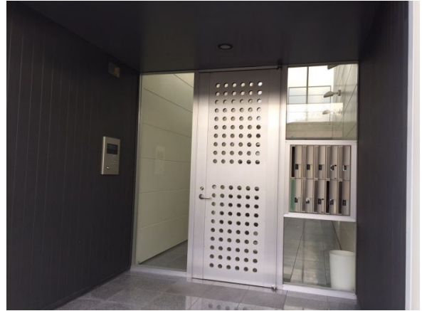
オートロック完備です