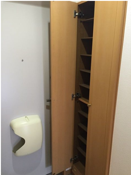
靴の収納もバッチリ!