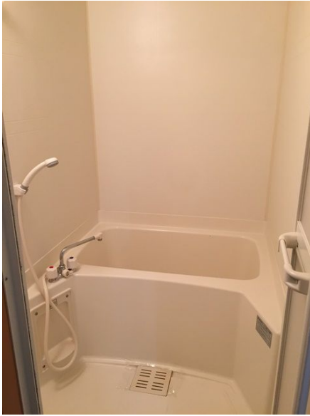
ユニットバスです