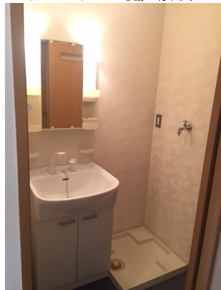
シャンプードレッサーの洗面台、隣は洗濯機置き場です