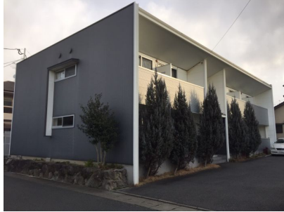
おしゃれな外観です