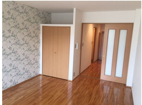
クローゼットの上にも棚があります