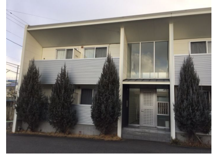
南向きバルコニー♪