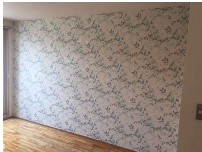
アクセントクロスはボタニカル×小鳥の柄!