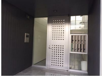
オートロック完備です