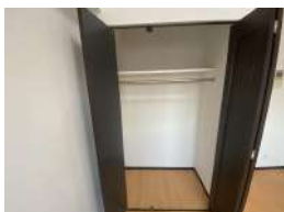
洋室にクローゼットあり！玄関に靴箱あり！