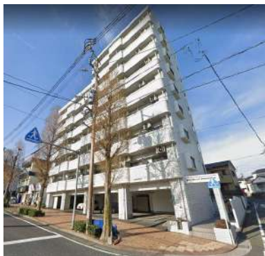
外観タイル貼りの9階建てマンション

北九州市八幡東区の桃園公園そばに位置する「ライオンズマンション桃園公園」最上階！！9階のお部屋で入居者様を募集しております！ 国道3号線から山側に入った通り沿いで、 黒崎方面・八幡方面にアクセスが良く便利な立地です 近くには「コメダ珈琲」や「カフェファディ」など暮らしが楽しくなる施設が複数ございます！ 九州国際大学にも近いので、学生さんの一人暮らしにもお勧めです！ オートロック、TV付きインターホンなど安心の分譲賃貸マンション！