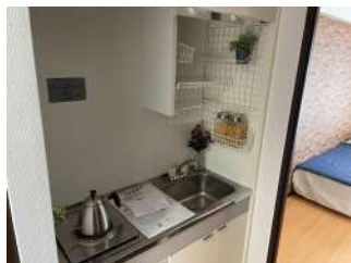
キッチンにはミニ冷蔵庫付き！