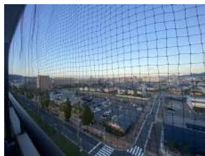
最上階9階からの 眺望良好！