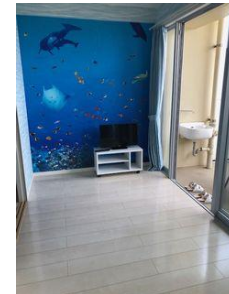
洋室 アクセントクロス