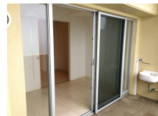
バルコニーから 室内の様子