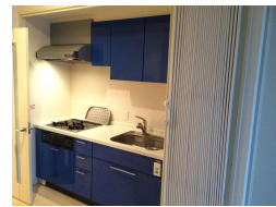
3口のガスコンロ、グリル付 ディスプレイシステムあり