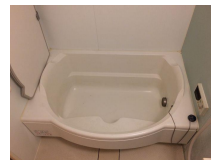
円弧状のバスタブ！