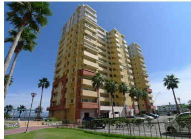
クルーズ棟の外観