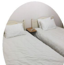
サービス設置品を ご利用頂けます！