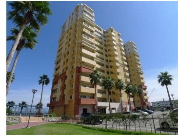
クルーズ棟の外観です