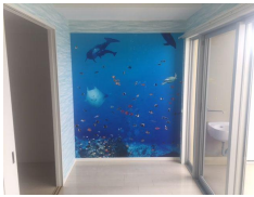
アクセントクロスは海中風景！