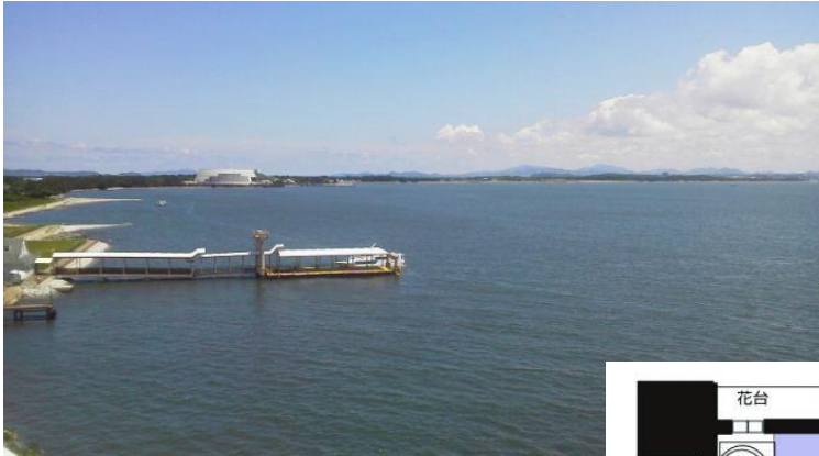
海に面した分譲賃貸マンション！