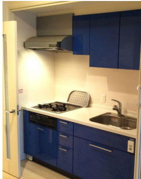
3口のガスコンロ、グリル付！ ディスプレイシステム！