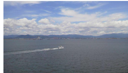
8階からの眺めは良好！！