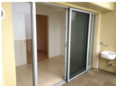
白を基調とした明るい室内！