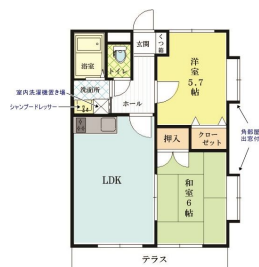
【間取り図】出窓も付いてて明るいお部屋です♪