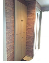
玄関にはシューズボックス