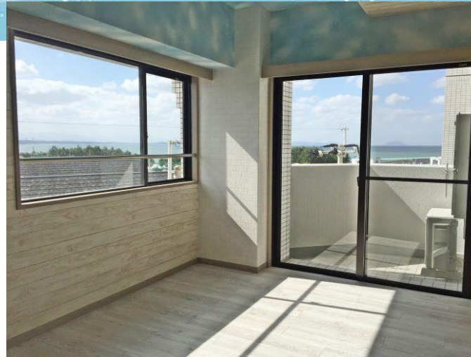
お部屋からは海を臨む眺望！

近くに「フレスポ花見ヶ丘」(ショッピングモール)が でき、お買い物にも便利です マンションから徒歩13分