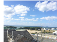
バルコニーからの眺め