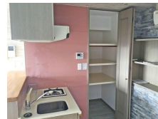
キッチンにはうれしい収納