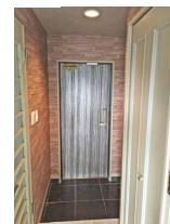
落ち着いた雰囲気の玄関