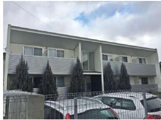
デザイナーズ・アパート！