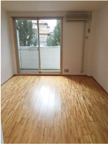
洋室9帖 陽当たり良好！

福岡歯科大学・福岡看護大学 近く！ デザイナーズ・アパート！ オートロック付きで女性にも安心♪