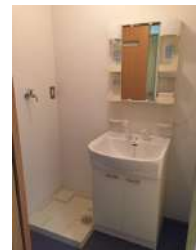
◆シャブードレッサー