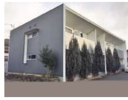
オシャレな外観です(^^)