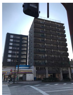
◆ 隣にコンビニ有り